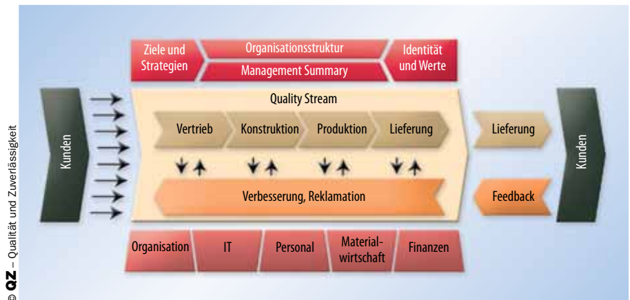
Bild 1. Erste Strukturierungsebene des Q.Wiki: Basis ist das Aachener Qualitätsmanagement-Modells

Für Siebenwurst waren die internen Prozesse schon immer ein wertvolles Kapital, welches in Kombination mit dem fundierten fachlichen Wissen der Mitarbeiter einen entscheidenden Wettbewerbsvorteil gegenüber den vielen Konkurrenten auf dem hart umkämpften Markt des Formen- und Werkzeugbaus darstellt. Diese beiden Vorteile sollten nun in einem System zusammengeführt werden. Gleichzeitig war es für das Einführungsprojekt ein Ziel, die Prozesse der Auftragsabwicklung, gerade an den Schnittstellen zwischen einzelnen Abteilungen, präziser zu definieren, um den